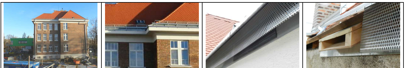
Fotos Michael Stocker Zoologe, Foto rechts außen: Spaltenquartier, bevor es ganz ins Zwischendach eingeschoben wurde.